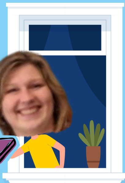
ARINE HOFMAN ONAFHANKELJKE INWONERSONDERSTEUNER